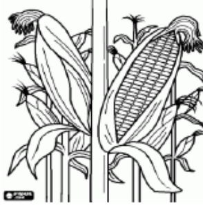
Segundo plantio - milho