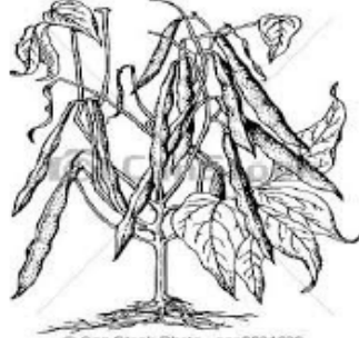
Primeiro plantio - feijão