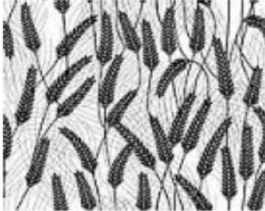
Terceiro plantio - centeio