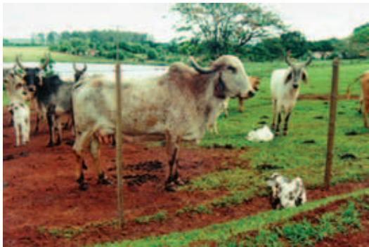
BEZERRO DO OUTRO LADO DA CERCA

Os estímulos externos podem prejudicar o reconhecimento entre mãe e filhote. Sabemos que em áreas com muito movimento as vacas geralmente interrompem o contato com o bezerro, deixando de cuidar da cria para ficar em vigilância. Com isto, há um aumento no tempo que os bezerros levam para se levantar e mamar.