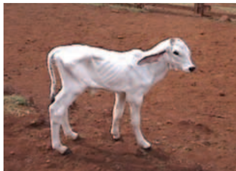
BEZERRO COM O VAZIO FUNDO, INDICATIVO DE FALHA NA PRIMEIRA MAMADA