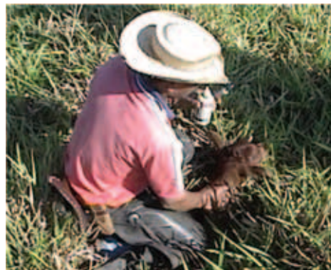
CUIDANDO DO BEZERRO NO LOCAL DO NASCIMENTO