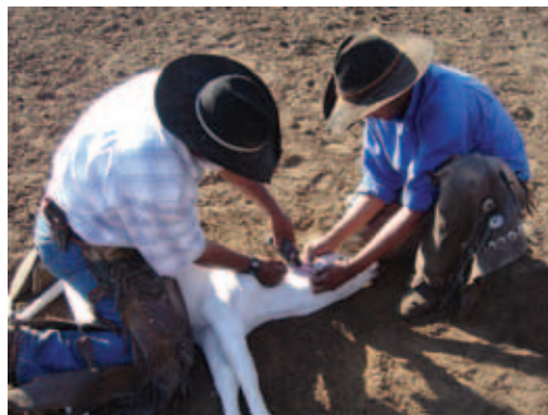
BEZERRO CONTIDO COM EFICIÊNCIA

Não jogue o bezerro no chão , levante-o um pouco do solo e utilize sua perna como apoio para descê-lo ao chão. A contenção para manter o bezerro deitado deve ser feita sem força exagerada.