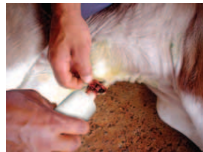
ASSEPSIA DO UMBIGO

É recomendado pesar os bezerros no dia seguinte ao nascimento. O ideal é usar balanças portáteis para que possam ser levadas ao pasto-maternidade. Caso não haja disponibilidade de balança na fazenda pode-se avaliar o peso dos bezerros considerando três categorias: leve, médio e pesado.