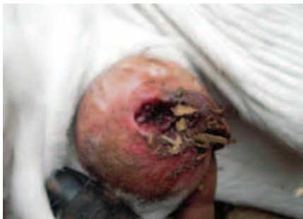
UMBIGO COM BICHEIRA

Em casos específicos, como os de bezerros com umbigos inflamados e bezerros muito fracos, pode ser aconselhável a utilização de antibióticos, que devem ser recomendados pelo veterinário responsável.