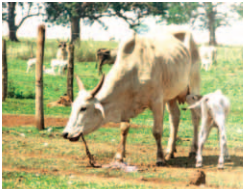
VACA COMENDO PLACENTA

Vacas muito gordas ou muito magras apresentam maior risco de problemas de parto; as gordas por apresentarem contrações mais fracas e as magras podem não terem a energia necessária para o trabalho de parto.