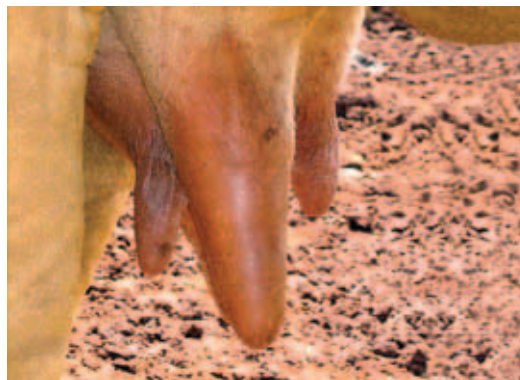
TETO NÃO MAMADO

Nos casos em que ocorrer abandono ou troca de bezerros deve-se aproximar a mãe de seu filho, mantendo-os juntos em local tranquilo para que possam formar os laços materno-filiais.