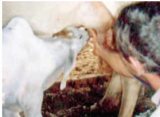
AUXÍLIO PARA MAMAR