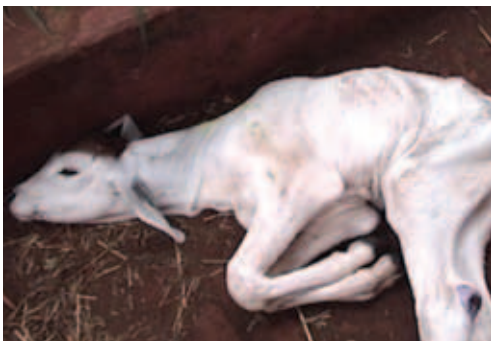
BEZERRO PROSTRADO, INDICATIVO DE BAIXO VIGOR