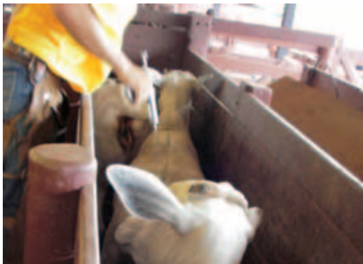
REAÇÃO DO BOVINO AO MANEJO DE VACINAÇÃO

Este manual foi desenvolvido com base em pesquisa realizada pelo Grupo ETCO-UNESP (Chiquitelli Neto, M., Paranhos da Costa, M.J.R., Páscoa A.G. e Wolf, V., 2002, Manejo racional na vacinação de bovinos Nelore: uma avaliação preliminar da eficiência e qualidade do trabalho. In: L.A. Josahkian (ed.) Anais do 5º Congresso das Raças Zebuínas, ABCZ: Uberaba-MG, p. 361-362) na Fazenda São Marcelo, em Tangará da Serra-MT. Foram acompanhados os procedimentos usuais de vacinação para identificação de pontos críticos. A partir da caracterização dos principais problemas, foi definida uma nova forma para vacinar bovinos de corte, o Manejo Racional na Vacinação , cujo conteúdo é apresentado neste manual.