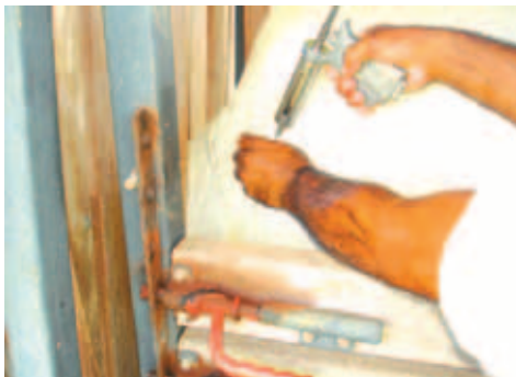
MANEJO RACIONAL NA VACINAÇÃO

A adoção do manejo racional na vacinação proporciona benefícios econômicos diretos, com diminuição na perda de vacina, de danos aos equipamentos (seringas quebradas e agulhas tortas) e de riscos de acidentes de trabalho, melhorando a rotina de atividades nas fazendas.