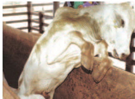
RISCOS DO MANEJO CONVENCIONAL NA VACINAÇÃO