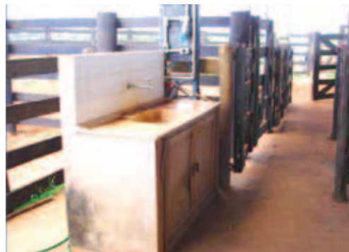
LOCAL DE TRABALHO LIMPO E ORGANIZADO

A água para esterilização deve ser colocada para ferver antes de começar o trabalho e deve ser trocada com frequência, para que esteja sempre limpa.