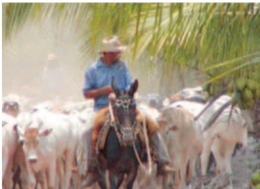
CONDUÇÃO DO GADO COM PONTEIRO

A condução dos animais até o curral deve sempre ser realizada com calma, sem correrias ou gritos, deslocando os animais de preferência ao passo. Use sempre um cavaleiro em frente ao gado “chamando” os animais (ponteiro). Não use ferrão e evite usar o bastão elétrico.