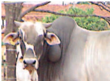
ANIMAIS COM ABSCESSOS PURULENTOS