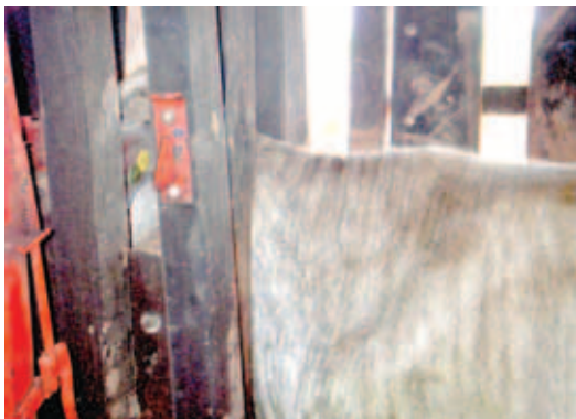
ANIMAL CONTIDO, PRONTO PARA SER VACINADO

A equipe de trabalho deve estar bem posicionada: uma pessoa cuida da porteira de entrada e da contenção do posterior do animal (quando necessário) e outra cuida da porteira de saída e da pescoceira. Com o animal contido, um deles realiza a aplicação da vacina. Com isto, há diminuição do risco de acidentes e menor desgaste dos vaqueiros. No caso de mais de um tipo de vacina ou de aplicação simultânea de vermífugos, é conveniente contar com mais uma pessoa, aplicando os produtos em lados opostos do pescoço do animal.