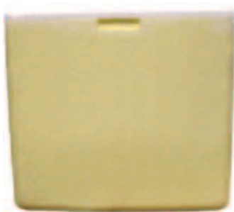
CAIXA TÉRMICA TAMPADA

É recomendado esterilizar as agulhas durante a vacinação, de preferência em água fervente. Para isto, tenha à mão os seguintes equipamentos: ebulidor elétrico ou fogareiro, vasilha de metal, pinça (de bambu ou madeira para pegar as agulhas da água fervendo, (nunca de metal se usar o ebulidor elétrico) e papel absorvente limpo (para que a agulha seque e esfrie antes que seja novamente usada).