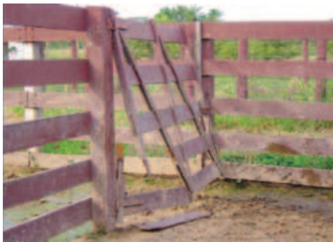
INSTALAÇÕES EM MAU ESTADO DE CONSERVAÇÃO

Alguns dias antes da vacinação, faça uma completa revisão das instalações. Procure manter o piso limpo e seco, com isto os riscos de escorregões e quedas serão menores. O ideal é percorrer o caminho por onde os animais serão conduzidos no curral, verificando se há situações que podem machucá-los (pregos salientes, pedras soltas no chão, buracos, pontas de tábuas e quinas) e que dificultem a sua condução (degraus, poças d'água, lama, sombras e objetos estranhos no caminho). Na medida do possível, esses problemas devem ser corrigidos imediatamente.