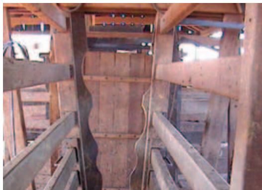
PESCOCEIRA COM SALIÊNCIAS

Dentro do curral, procure trabalhar com lotes de, no máximo, 20 animais. Evite mantê-los por longo tempo nos compartimentos do curral (mangas). Leve os animais ao brete sem correria, gritos ou choques. Não encha o brete a ponto de apertar os animais, nem as mangas, onde eles devem ocupar no máximo metade do espaço disponível.