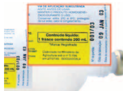
DATA DE VALIDADE E BULA DA VACINA

Dose de reforço: quase todas as vacinas para os bovinos, para expressarem seu efeito máximo, precisam de uma dose de reforço quando o animal a recebe pela primeira vez em sua vida, seguida de doses complementares semestrais ou anuais conforme a orientação do fabricante.