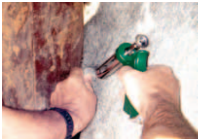
APLICAÇÃO SUBCUTÂNEA CORRETA

No caso da vacinação intramuscular, a aplicação deve ser feita no interior do músculo. Para este tipo de vacinação, devemos utilizar agulhas como recomendado na tabela da página 23. Também neste caso, a aplicação deve ser feita na tábua do pescoço, deixando o conjunto seringa-agulha em posição perpendicular ao corpo do animal.