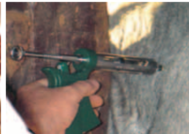
APLICAÇÃO INTRAMUSCULAR CORRETA