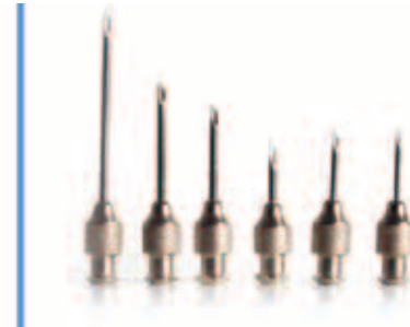
AGULHAS EM BOAS CONDIÇÕES