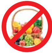
Frutas e Verduras