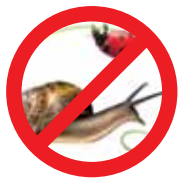
Insetos, Moluscos, Bactérias e Fungos

E-mail: vigiagro@agricultura.gov.br e malalegal@agricultura.gov.br todos os dias ininterruptamente. O cidadão terá resposta a seu questionamento em até 5 dias úteis, conforme a ordem de chegada da mensagem.