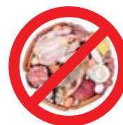
Carnes, pescados, embutidos e enlatados