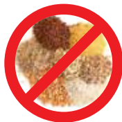
Sementes, Grãos e Mudas