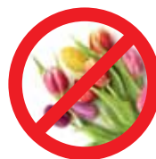
Flores e Plantas