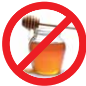
Mel e Derivados