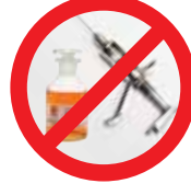
Produtos Veterinários e Agrotóxicos