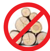
Terra ou Madeira