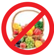
Frutas e Verduras