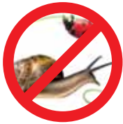
Insetos, Moluscos, Bactérias e Fungos

E-mail: vigiagro@agricultura.gov.br e malalegal@agricultura.gov.br todos os dias ininterruptamente. O cidadão terá resposta a seu questionamento em até 5 dias úteis, conforme a ordem de chegada da mensagem.