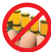
Ovos, Sêmen e Embriões